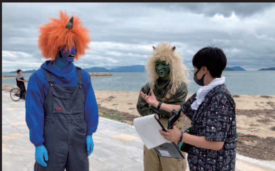
<女木島での撮影風景> 鬼の2人は島の移住者。 現在、合同会社「鬼の島」を運営し、きくらげなどを栽培している