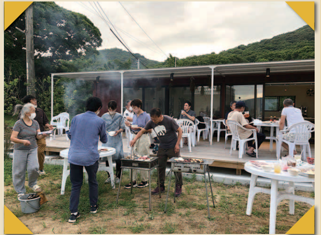
<島の方との懇親会> 島の暮らしや歴史についていんなお話を直接うかがう貴重な体験 映像制作のヒントになった