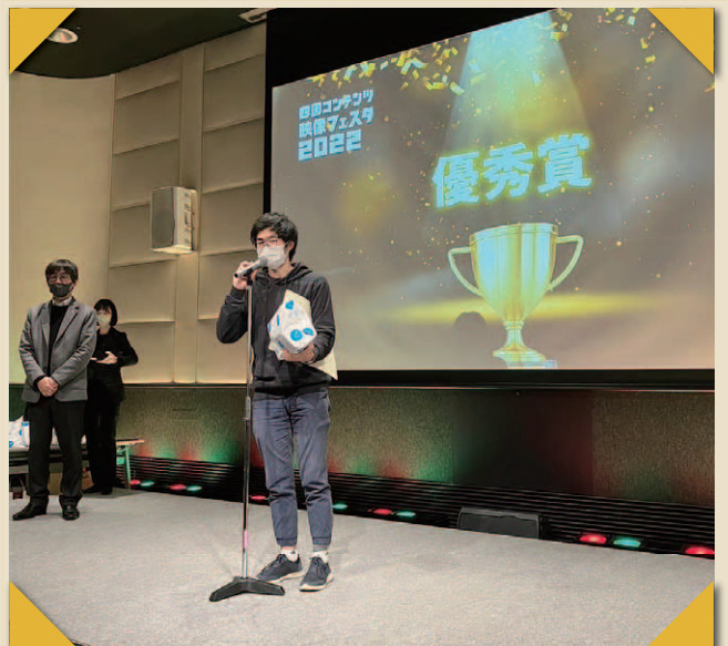
<総務省「四国コンテンツ映像フェスタ2022」> 1月24日に開催された上映審査会・表彰式/アマチュア部門・優秀賞を受賞