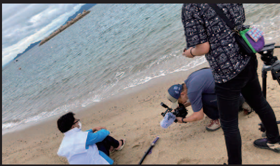
<女木島での撮影風景> 同期の仲間や友人、島の方の協力を得て撮影スタート