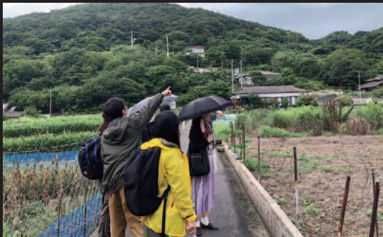
<女木島での撮影風景> ドローンを飛ばして島の絶景を撮影