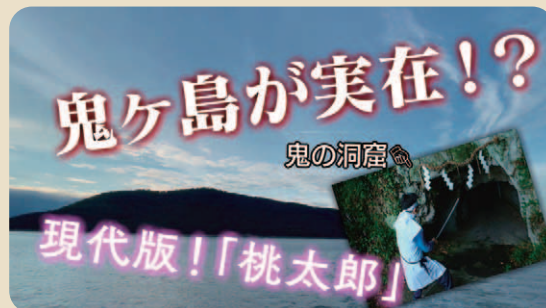
「鬼退治in女木島」は、「四国コンテンツ映像フェスタ2022」の公式YouTubeで公開中。 上下写真は、サムネイル画像