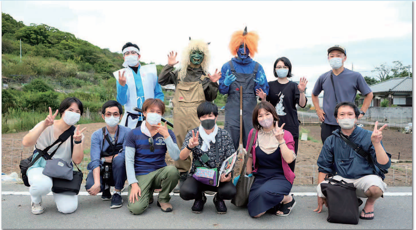
＜撮影後の記念写真＞ プロジェクトメンバー他、同期や島民の方など総勢15名で撮影

本プロジェクトは、「オリジナルの映像作品を制作し、地域の魅力発信に貢献したい」という思いからスタートしたもので、地域や社会の発展を目指す「夢チャレンジプロジェクト事業」の支援を受けて実現しました。また、多くの方に作品を見ていただくため、総務省「四国コンテンツ映像フェスタ2022」に応募チャレンジすることとしました。