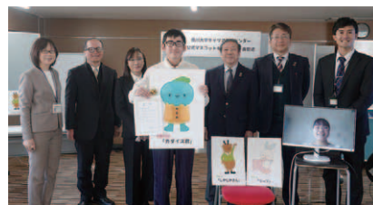
表彰式後の記念写真