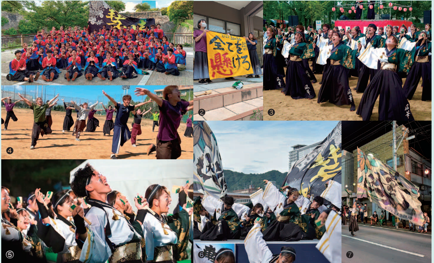
① 大阪こいや祭りに出場した際の全体集合写真 ② 高知よさこい・高松祭りに向けて全体スローガン発表 ③ 大阪こいや祭りで演舞の様子 ④ 全力で踊る普段の練習風景 ⑤ さぬぎ高松祭りで演舞の様子 ⑥ 神戸よさこい祭りで演舞の様子 ⑦ 高知よさこい祭りでの街頭パレード演舞にて