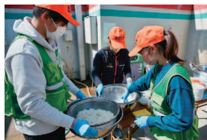
炊き出ししている様子

介を掲示しました。交流会参加者からは「一人ひとりの思いを知ることができ、心が温まった」と喜びの声をいただきました。